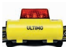
Tyłne czerwone światło