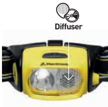
Skupione światło białe